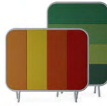
Quiet Riot 17